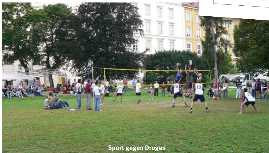
Sport gegen Drogen